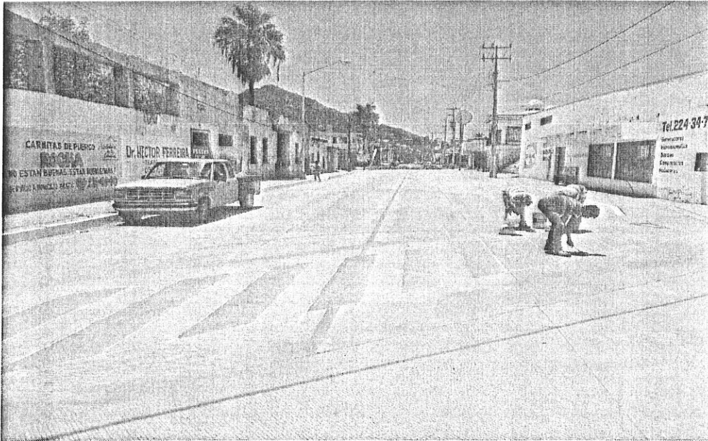
GUAYMAS-22-FIS MDF-SI-08 Pavimentación con carpeta asfáltica e infraestructura hidráulica y sanitaria, en calle Cabo Corzo (2da etapa) en Colonia Ramón Gil Samaniego, en Guaymas, Sonora.